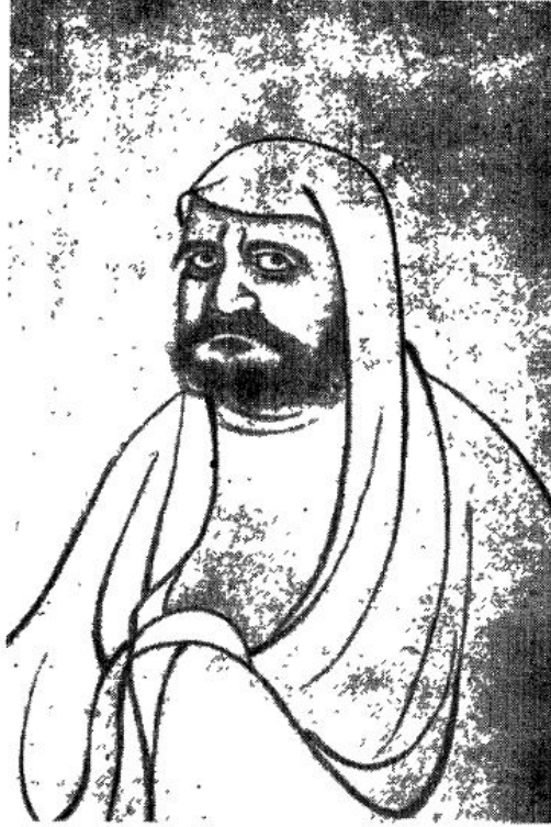
படம் 9. போதி தருமர்.

கொள்கையைப் போதித்துவந்தார். இவரது கொள்கை சங்கரரின் அத்வைதமதக் கொள்கையைப் போன்றது. இவர் கி. பி. 520 -இல் சீன தேசத்துக் காண்டன் பட்டினத்தைச் சேர்ந்ததாகக் கூறுவர். வேறு சிலர் கி. பி. 525 -இல் சீனதேசம் சென்றதாகக் கூறுவர். அக்காலத்தில் சீனதேசத்தை ஆண்டுவந்த லியாங் குடும்பத்தைச் சேர்ந்த ஊ-டி (Wu Ti) என்னும் அரசன் அவைக்களத்தில் இவர் தமது தியான மார்க்கத்தைப் போதித்தார்.